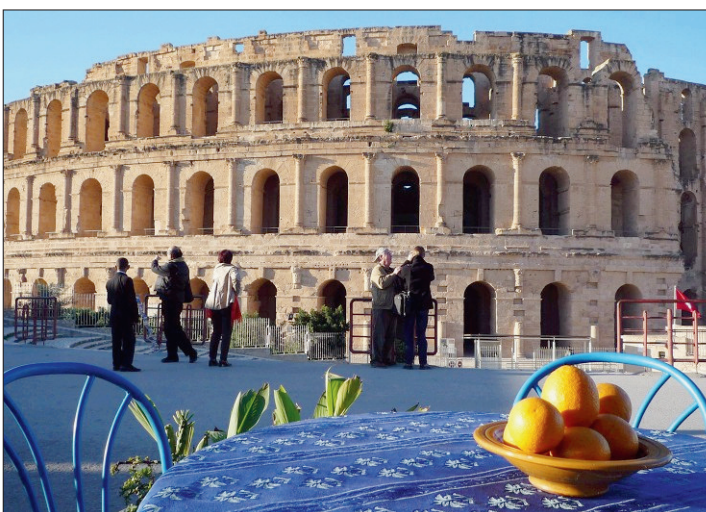
DIVERSITÉ Des thalassos pour clientèle huppée aux vestiges puniques, romains ou byzantins, la Tunisie peut offrir bien plus que ses 1300 km de côtes.

notre ère logeaient sur deux niveaux identiquement aménagés. Ce doublon devait leur permettre d'échapper aux canicules en se réfugiant durant l'été dans les parties les plus fraîches de leurs villas richement décorées. A Dougga, les archéologues n'ont-ils pas exhumé une tête de Jupiter, dont la statue entière devait atteindre 6m50!